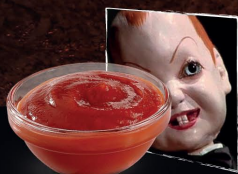
Profondo Rosso (Ketchup)