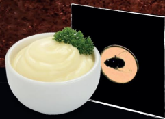
Velluto Grigio (Maionese)