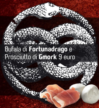
Bufala di Fortunadrago e Prosciutto di Gmork 9 euro

Fagioli di Balzar Con Crostoni Fumanti 6euro